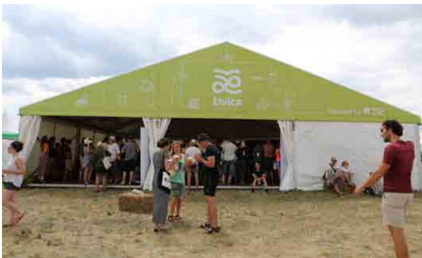
Stan organizácie Živica, ktorú ZSE partnersky podporuje, bol na Pohode napájaný prenosnou solárnou elektrárnou.

na festivale. Tie využívali energiu zo Slnka a po zotmení LED lampy osvetľovali runway a všetky dôležité plochy. «