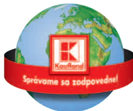
Zákazníci Kauflandu sa môžu zbaviť nepotrebného odpadu priamo v predajniach obchodného domu.