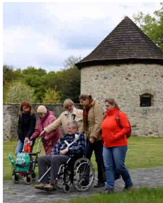
Dobrovoľníci zo spoločnosti HP už štvrtý rok navštevujú seniorov v DSS Rača.

V júni nadácia organizovala dobrovoľnícke podujatie na želanie pre zamestnancov firmy AbbVie. Na základe veľmi pozitívnej dlhodobej spolupráce si vybrali Domov sociálnych služieb v Rači. Zvelaďovali vnútorné priestory zariadenia a presádzali kvety. Vďaka nim je zariadenie nielen upravenejšie, ale svojou prítomnosťou pote-