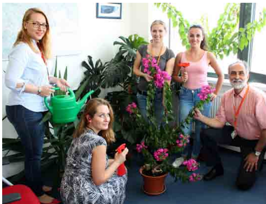
Zamestnanci spoločnosti TNT si počas Dňa kvetov presádzali a prihnojili kvety, ktoré im skrášujú kancelárie.

Niekedy stačí naozaj málo na to, aby ste ľuďom spríjemnili ich každodenný pobyt v práci. Trojčlennému kolektívu na personálnom oddelení v TNT na to stačil malý nápad, kúsok kreativity, jeden kalendár medzinárodných sviatkov a doslova pár eur.