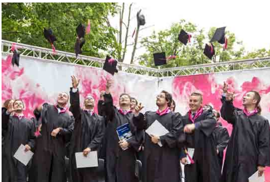
V Košiciach promovali prví absolventi trojročného duálneho vyššieho odborného štúdia. Dualisti študovali na Strednej priemyselnej škole elektrotechnickej v Košiciach a praktickú časť absolvovali v spoločnosti T-Systems Slovakia.

V Košiciach sa zrodili historicky prví absolventi duálneho odborného vzdelávania v oblasti informačno-komunikačných technológií na Slovensku. Dvadsaťdva mladých talentov, a odteraz už aj zamestnancov T-Systems Slovakia, ukončilo 3-ročné vyššie