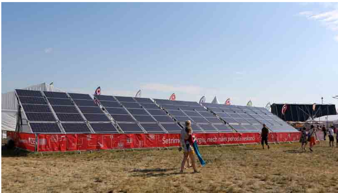
Solárne panely spoločnosti ZSE zásobili festival Pohoda elektrickou energiou.

ZSE priniesla na tohtoročnú Pohodu svetlo, energiu aj diskusie o alternatívach v oblasti vzdelávania a životného prostredia. Spolu s partnerskou organizáciou Živica ponúkla zaujímavé pohľady na témy školstva, školských záhrad, prírodného staviteľstva či významu spirituality v dnešnom svete.