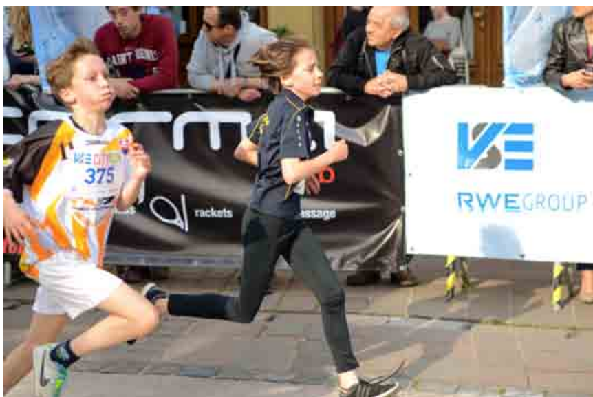
Do charitatívneho behu VSE CITY RUN sa v Košiciach a Prešove zapojilo celkovo viac ako 4 000 bežcov, ktorí svojim štartovným podporili vybudovanie cestovinárne v prešovskom Centre pre obnovu rodiny Dorka.

Vyhráva jeden, pomáha každý. Už deviaty rok sa spoločnosť VSE Holding a.s. darí naplňať toto heslo prostredníctvom jedného z najväčších a najúspešnejších projektov, ktorý v sebe spája šport a charitu v jednom. V charitatívnom behu VSE CITY RUN totiž nejde o to, kto bude prvý, ale koľko ľudí, vrátane detí, príde na štart. Každé euro vyzbierané cez štartovné totiž smeruje na dobrú vec.