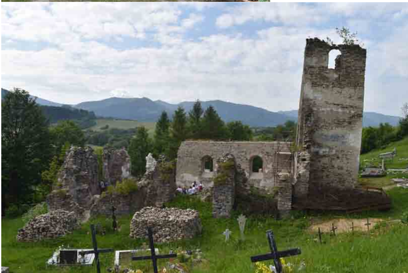
Zamestnanci spoločnosti SSE počas dní firemného dobrovoľníctva Naše mesto pomáhali pri prácach v gotickom kostole sv. Heleny v Stránskom.

Druhá aktivita, z dielne združenia Obnova Slovenskej Zeme , zahŕňala úpravu terénu a cintorína a pomoc pri archeologických prácach v gotickom kostole sv. Heleny v Stránskom. Pri výkopoch sa našli aj ľudské pozostatky, čo väčšina prítomných videla na vlastné oči po prvý raz. «