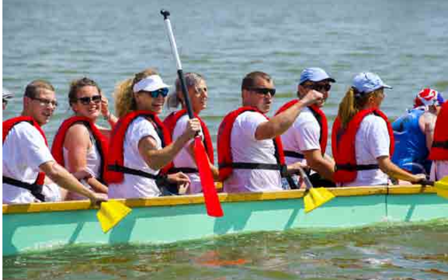
Zamestnanci Skanska SK a ich rodiny si leto spríjemnili pretekmi Dračích lodí.

A že tento rok bol ozaj letný, dokazovala aj ručička teplomeru, ktorá atakovala 36 stupňov v tieni. Avšak ani tieto tropické horúčavy nebránili vyše 300 účastníkom zo všetkých slovenských závodov zabojsť v Novákoch